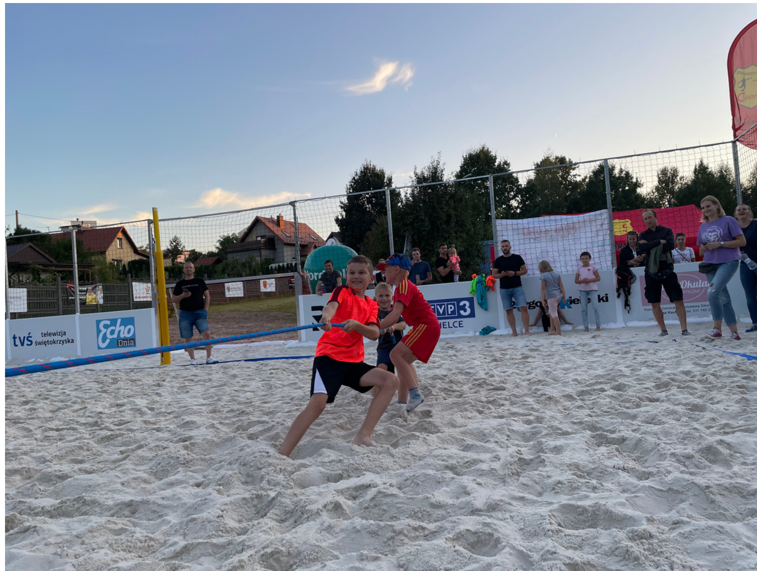
Młodzi waleczni Sport CK