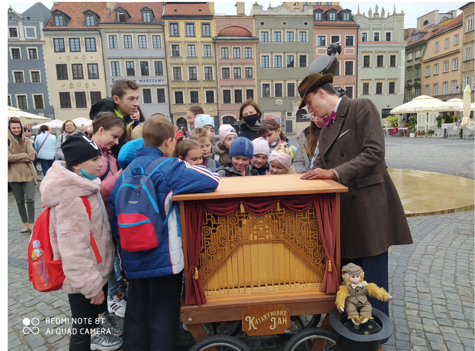
Poznajmy się od nowa