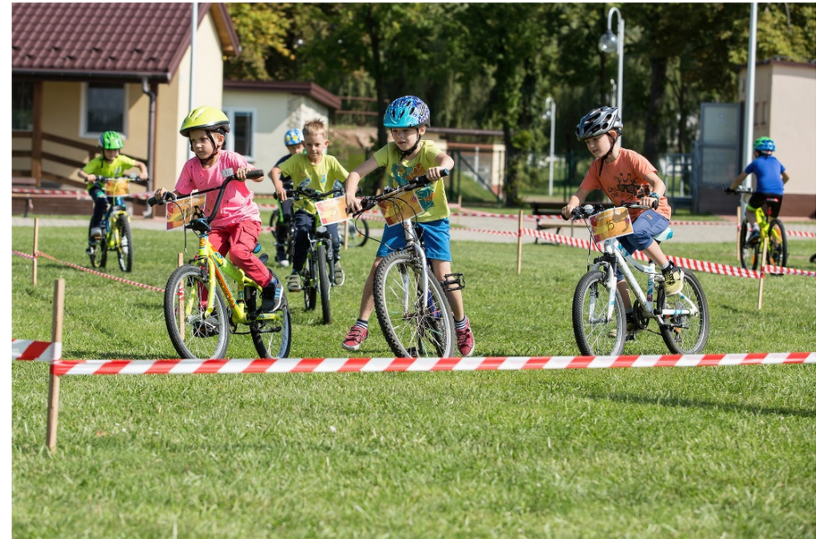
Międzypokoleniowo i smacznie- warsztaty kulinarne