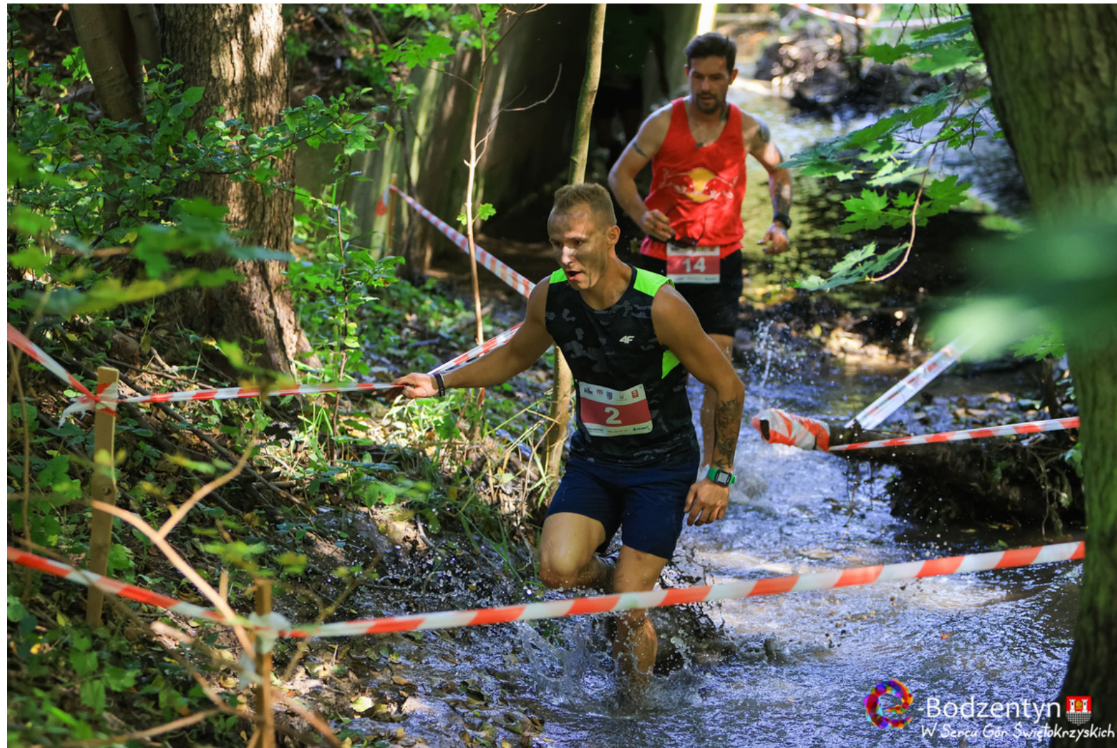
Grandarun - Ekstremalny Bieg Świętokrzyski